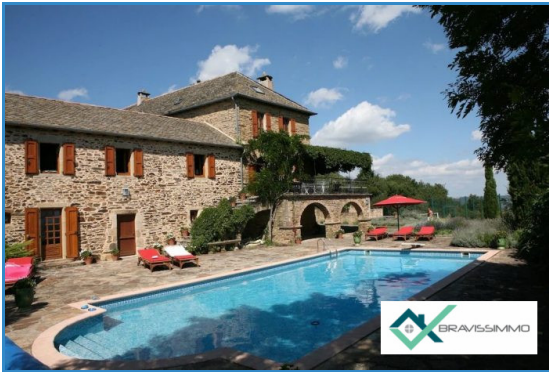
Coup de cœur